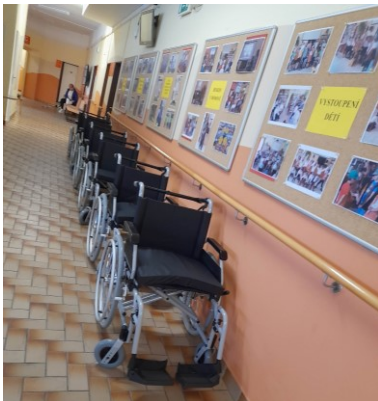
Obrázek č. 8: Mechanické vozíky pro pohyb v exteriéru

K nejoblíbenějším aktivitám klientů patří procházka mimo zařízení, do města, do cukrárny apod. Vzhledem k podmínkám a přístupovým cestám bývá nutný doprovod a vhodný mechanický vozík pro pohyb mimo budovu. Řešením byl nákup šesti kusů mechanických vozíků, abychom zajistili bezpečný a snadnější přístup do města a podpořili tak klienty k využívání návazných služeb.