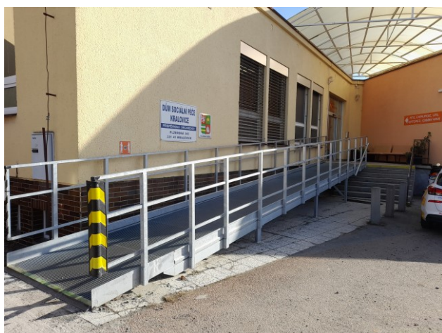
Obrázek č. 6: Nové bezbariérové řešení a nové vstupní dveře

Zadní vstup do budovy je v současné době prostorem stavby, proto bylo nutné zajistit bezbariérový přístup z parkoviště u hlavního vstupu. V letošním roce také proběhla instalace hlavních vstupních dveří, které jsou s automatickým otevíráním, abychom umožnili i imobilním klientům snadnější průchod. Pro vytvoření podmínek zejména pro klienty s omezením pohybu jsou využívány vyvýšené záhony, které jsme nově instalovali k oplocení u hlavní brány. Záhony umožňují pěstování oblíbené zeleniny a květin. Na venkovní terase oddělení „B“ se nacházejí truhlíky, které si klienti sami osázejí a pečují o rostliny. Tato varianta záhonů a truhlíků umožňuje nadále se věnovat svým zálibám i zahrádkářům z řad klientů na mechanickém vozíku.