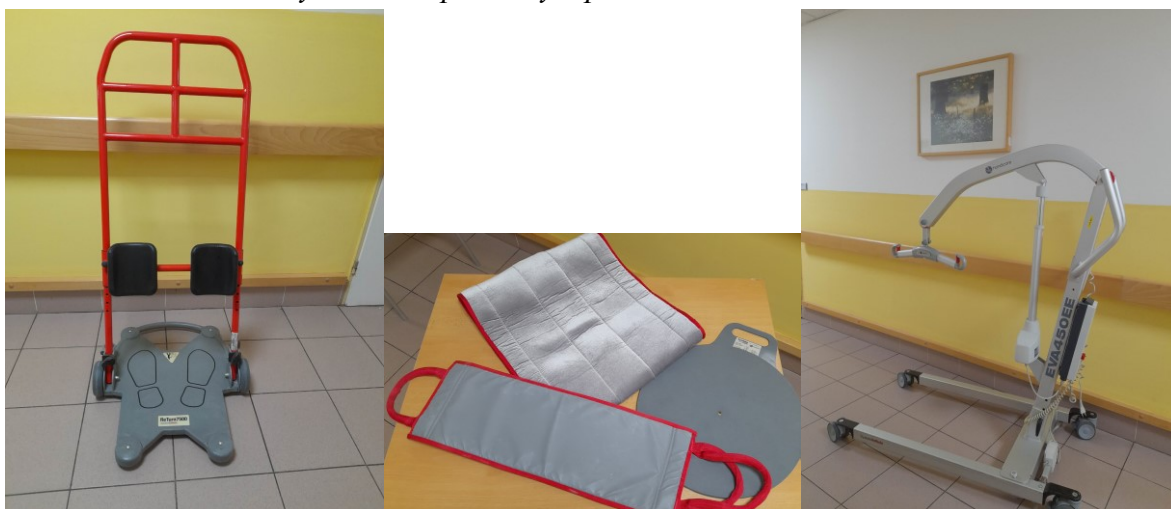
Obrázek č. 7: Elektrický zvedák a pomůcky k přesunu klienta

Při každodenní práci s klientem používáme různé pomůcky k šetrnému přesunu klienta z lůžka na vozík a zpět. Každé oddělení je vybaveno elektrickými zvedáky pro přesun imobilních klientů. Využíváme také dvě pojízdné plošiny, které umožňují přesun klienta z lůžka na mechanický vozík a zpět a přesun klienta na toaletu v případě zachování jeho schopnosti stoje s oporou. Tyto pojízdné plošiny jsou také využívány pro nácvik vertikalizace do stoje. K šetrné manipulaci s imobilními klienty v lůžku používáme další speciální pomůcky, jako např. skluzné podložky, které jsou využívány i v rehabilitační péči. Dále používáme elektrický zvedák Raizer, který umožňuje snadné zvednutí osoby ze země po pádu. Dostatek pomůcek tak zajišťuje jejich snadnou dostupnost pro všechny pracovníky, kdykoliv je potřebují.