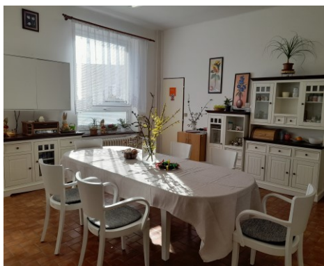
Obrázek č. 4: Jídelna na oddělení péče „C“

Dalším velmi využívaným prostorem klientů je jídelna na oddělení „C“. Zde se často klienti setkávají u různých společných aktivit. Jednou z nejoblíbenějších je pečení a posezení u odpolední kávy.