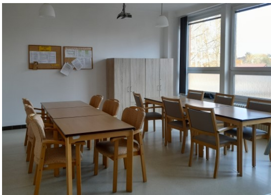
Obrázek č. 3: Návštěvní místnost a společenská místnost

Klidným místem pro setkávání klientů a jejich blízkých je návštěvní místnost .