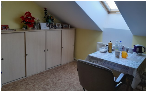
Obrázek č. 2: Možnost vlastního vybavení pokoje

Všechny pokoje jsou vybaveny polohovacími ošetrovatelskými lůžky. V současné době používáme v péči 90 lůžek s elektrickým polohováním. Pokoje jsou standardně vybaveny skříňkou na osobní věci, nočními a jídelními stolky a židlemi.